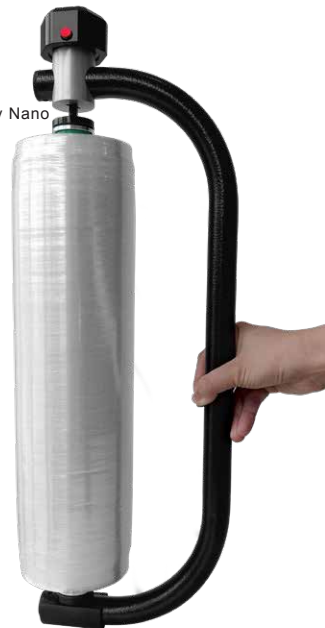
Stretchfilm Nano stable Hand plus PackSynergy Nano stable Dispenser