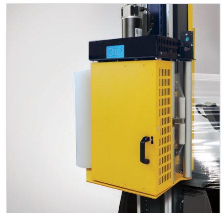
Folienschlitten LP mit motorischer Vorreckung 240%