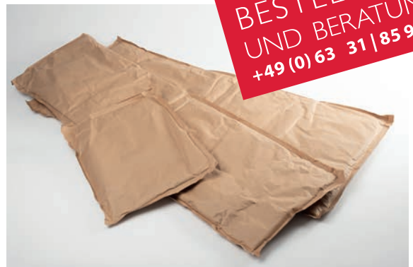
In Kombination mit dem richtigen Karton stehen 4 verschiedene Größen zur Auswahl.

Als Kühlmittel bieten wir Gelpacks. Sie sind hervorragend geeignet für den Versand von temperaturempfindlichen Produkten. Das enthaltene, wasserbasierende Kühlmittel ist für viele Kühlzyklen ohne Qualitätsverlust einsetzbar, enthält keinerlei giftige Stoffe und lässt sich deshalb problemlos im Hausmüll entsorgen. Individuell bedruckte Folie und außergewöhnliche Größen auf Anfrage.