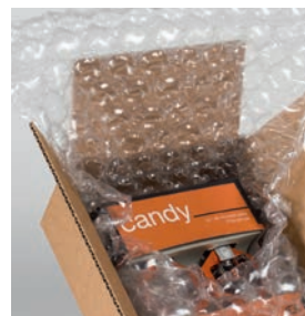
Anwendung mit Folie Bubble Wrap IB® Medium