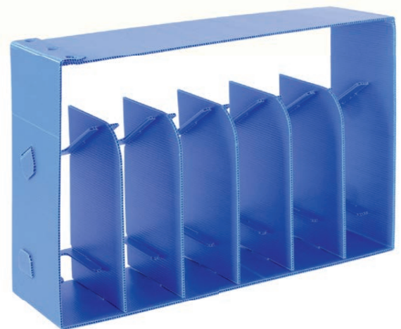
Hohlkammerplatten aus PP (Polypropylen – Copolymer) für konstruktive Verpackungen.

Wir setzen K-Flex als konstruktive Verpackungen, Gefache und Zwischenlagen, in der Werbetechnik (Beschilderung), für Verkleidungen jeglicher Art, Point-of-Sale-Displays, Werbeflächen sowie in der Automobil- und Elektronik-Industrie ein. Die Hohlkammerplatten sind doppelwandig extrudiert, gewährleisten so eine hervorragende Festigkeit im Verhältnis zum Gewicht.